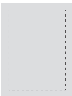
HELSIDA - 225×297 mm Satsyta 179×251 mm