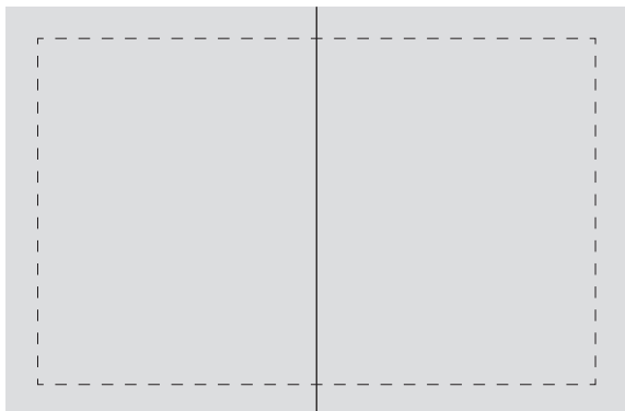
UPPSLAG – 450×297 mm Satsyta 404×251 mm